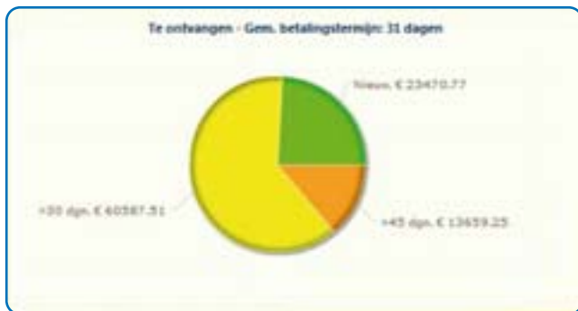
Stel samen met uw kantoor kengetallen vast en u heeft direct zicht op de stand van zaken. Ook de openstaande posten kunt u direct aflezen.

In veel schermen kunt u bovenaan kolommen een bepaalde waarde deels of volledig invoeren. U krijgt dan direct een selectie te zien van alle gegevens die aan die (deel)waarde voldoen. Zo filtert u bijvoorbeeld direct alle BV's uit het cliëntenbestand.