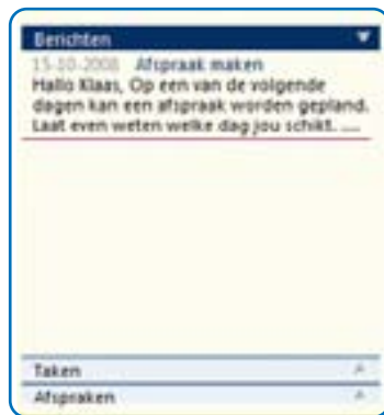
Berichten, taken en afspraken direct gekoppeld aan uw administratie.

Uw kantoor kan u berichten sturen die alleen voor u van belang zijn. Door deze berichten in het systeem op te nemen (en niet als e-mail te versturen), zijn ze altijd terug te vinden en exclusief gekoppeld aan uw administratie.